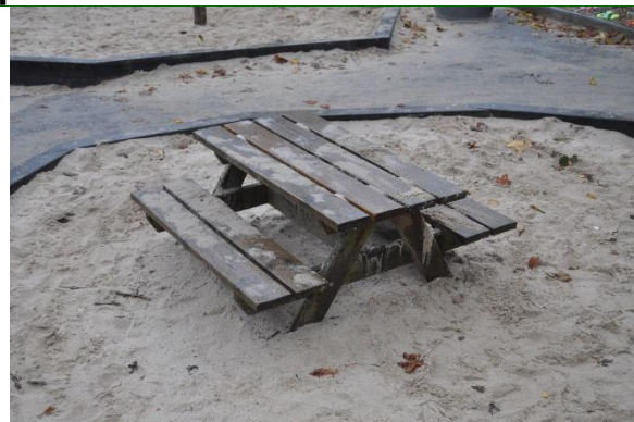
Redskab: Bordbænke Ikke omfattet af DS/EN 1176 Emne 2: