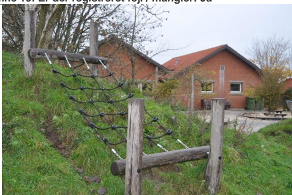
Redskab: Klatretnet Producent: Kompan Er redskabet mærket: Ja Emne 21: Er der registreret fejl / mangler: Nej