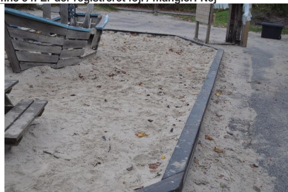
Redskab: Sandkasse Producent: JRJ Ribe Er redskabet mærket: Ja Emne 36: Er der registreret fejl / mangler: Nej