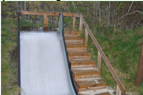
Redskab: Rutsjebane Producent: Er redskabet mærket: Nej Emne 19: Er der registreret fejl / mangler: Ja