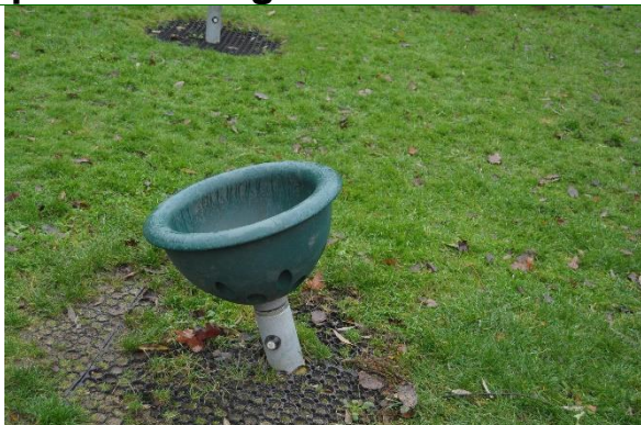
Redskab: Drejekar Producent: Kompan Er redskabet mærket: ja Emne 25: Er der registreret fejl / mangler: Nej