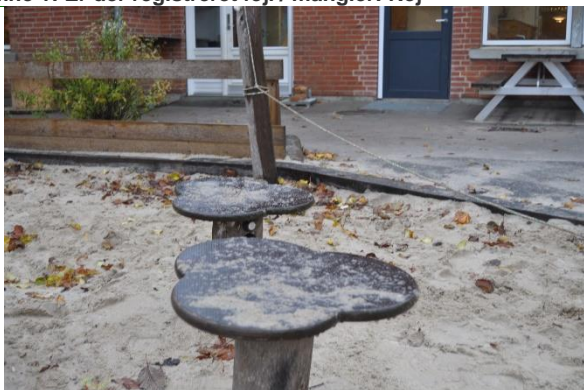
Redskab: Legebord Årgang: 2017 Producent: Kompan Er redskabet mærket: Ja Emne 3: Er der registreret fejl / mangler: Nej