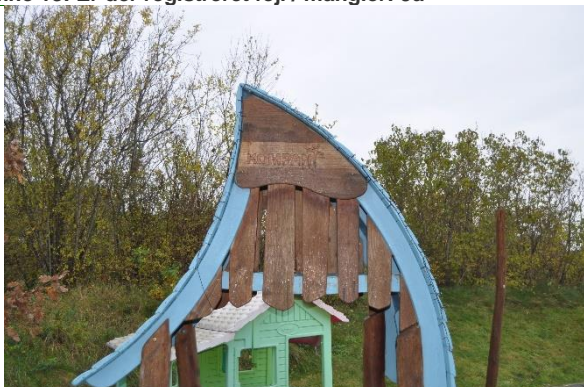
Redskab: Legehus Producent: Kompan Er redskabet mærket: ja Emne 15: Er der registreret fejl / mangler: ja