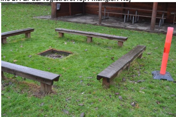
Redskab: Bordbænke Ikke omfattet af DS/EN 1176 Emne 29: