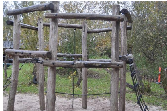
Redskab: Klatretårn Producent: Lekolar Er redskabet mærket: ja Emne 20: Er der registreret fejl / mangler: Nej