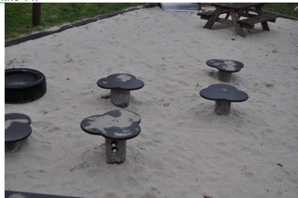
Redskab: Legebord Producent: Kompan Er redskabet mærket: ja Emne 16: Er der registreret fejl / mangler: nej