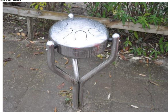
Redskab: Babel drum Producent: Percussionplay.com Er redskabet mærket: Ja Emne 24: Er der registreret fejl / mangler: Nej