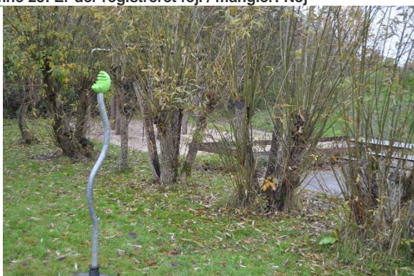
Redskab: Spica Producent: Kompan Er redskabet mærket: Ja Emne 27: Er der registreret fejl / mangler: Nej