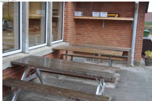
Redskab: Bordbænke Ikke omfattet af DS/EN 1176 Emne 4: