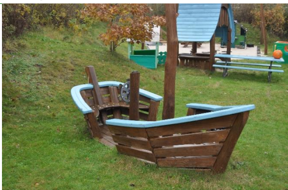
Redskab: Legebåd Producent: Kompan Er redskabet mærket: Ja Emne 13: Er der registreret fejl / mangler: Ja