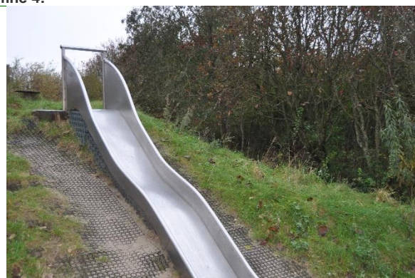
Redskab: Rutsjebane Årgang: Producent: Er redskabet mærket: Nej Emne 6: Er der registreret fejl / mangler: Ja