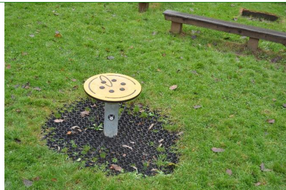
Redskab: Spinnerplade Producent: Kompan Er redskabet mærket: ja Emne 26: Er der registreret fejl / mangler: Nej