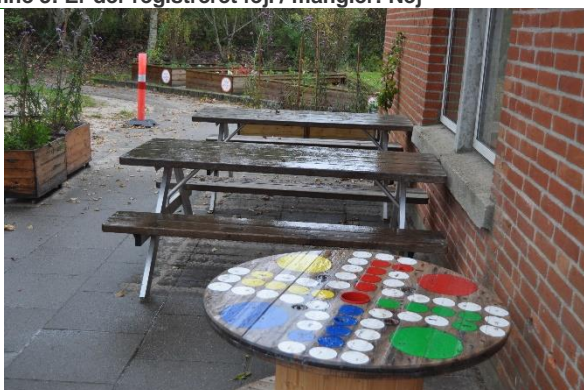
Redskab: Bordbænke Ikke omfattet af DS/EN 1176 Emne 5: