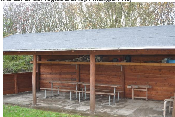
Redskab: Madpakkehus Ikke omfattet af DS/EN 1176 Emne 30: