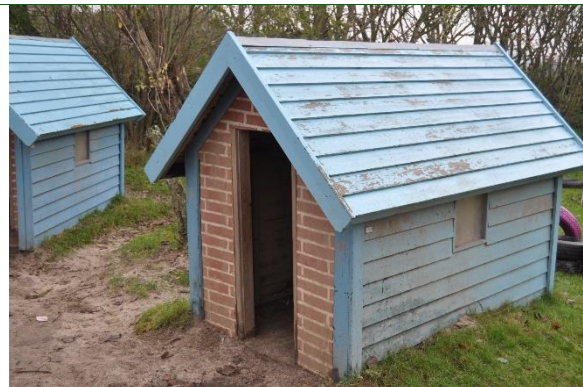
Redskab: Legehus Producent: Er redskabet mærket: ja Emne 32: Er der registreret fejl / mangler: Ja