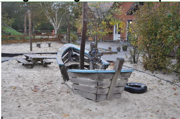
Redskab: Legeskib Årgang: 2017 Producent: Kompan Er redskabet mærket: Ja Emne 1: Er der registreret fejl / mangler: Nej