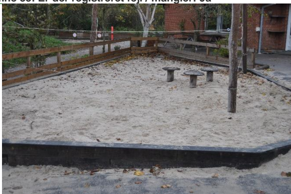
Redskab: Sandkasse Producent: JRJ Ribe Er redskabet mærket: Ja Emne 35: Er der registreret fejl / mangler: Nej