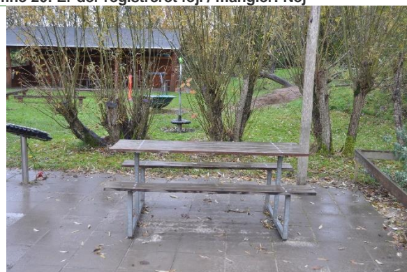
Redskab: Bordbænke Ikke omfattet af DS/EN 1176 Emne 22: