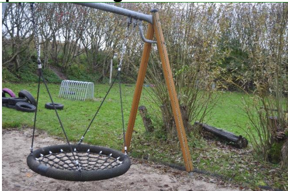
Redskab: Gyng Producent: Er redskabet mærket: ja Emne 31: Er der registreret fejl / mangler: Ja