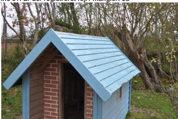
Redskab: Legehus Producent: Er redskabet mærket: Ja Emne 33: Er der registreret fejl / mangler: Ja